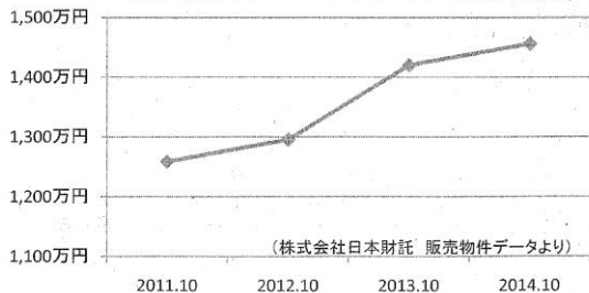
都内中古ワンルームマンションの平均価格の推移

月から12月における平均家賃は7万2548円でした。その後、2年間における同1期