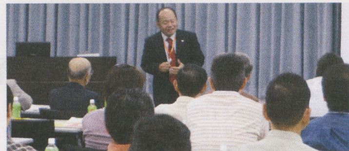
日本財託の不動産投資セミナー好評